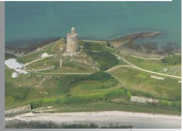
Le fort et la tour Vauban de la Hougue