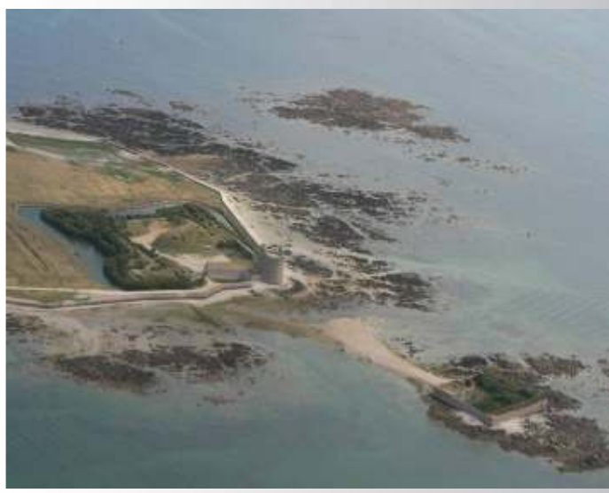
Le fort et la tour Vauban de Tatihou