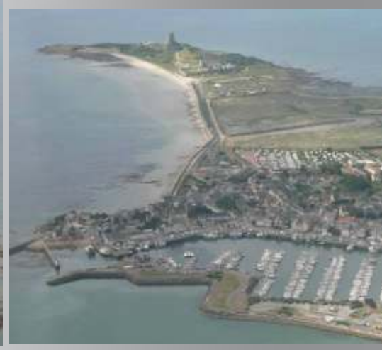
La rade de Saint- Vaast