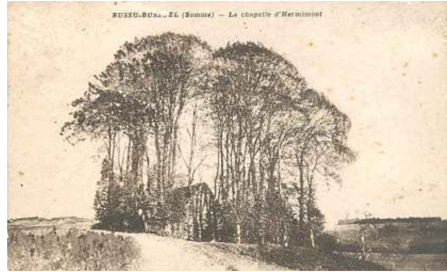
Chapelle d'Hémimont IXè - XVIè