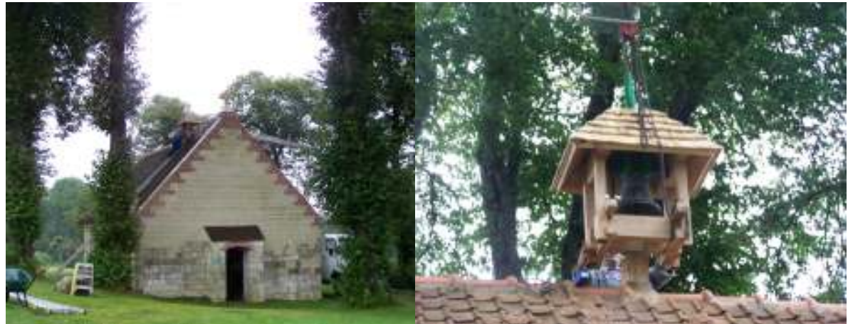
Pose du clocheton par le charpentier du moulin