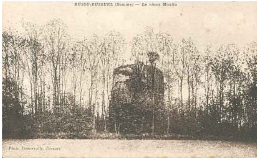
Moulin Vaillant-Tellier XVIIè