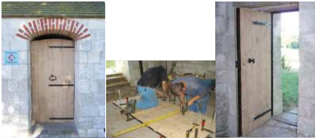
Habillage des portes en chêne